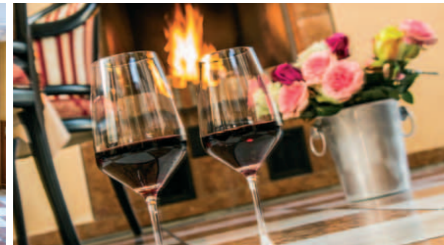
Unser Fürstenüberl. Perfektes Plätzchen für Genießer. Drinnen am Kamin oder draußen unterm gelben Sonnensegel!