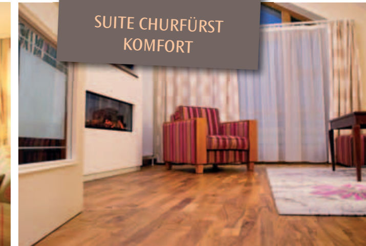
Mit wärmendem Kaminfeuer, Nespressomaschine & Südbalkon