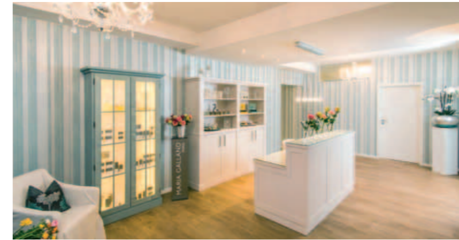
Sehr viel Platz für noch mehr Zeit: 200 qm SPA ROYAL

Da wär endlich mal Zeit zum Entspannen zu zweit!