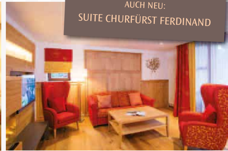
Natürlicher Chic in 2 Räumen: Suite Churfürst Ferdinand