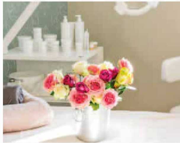
Sehr viel Platz für noch mehr Zeit: 200 qm SPA ROYAL