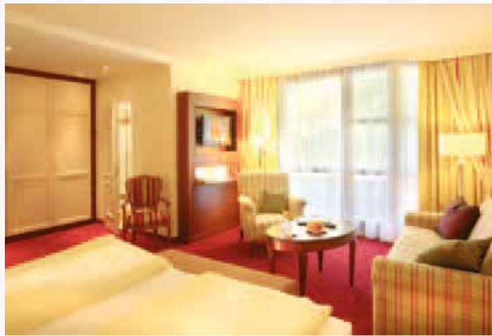
Gemütliche Schönheit: Doppelzimmer Prinzess