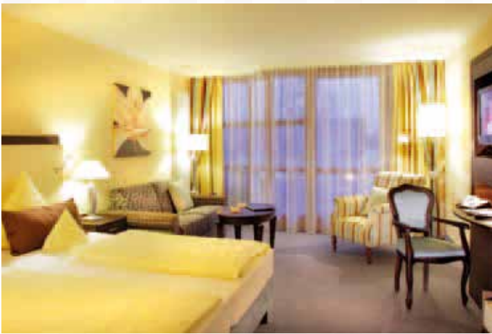
Wohnen in vanilleblau: Doppelzimmer Komtess