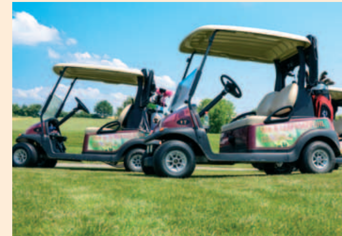
Ein Stückerl oberhalb unseres Hotels: Golfpark Bella Vista