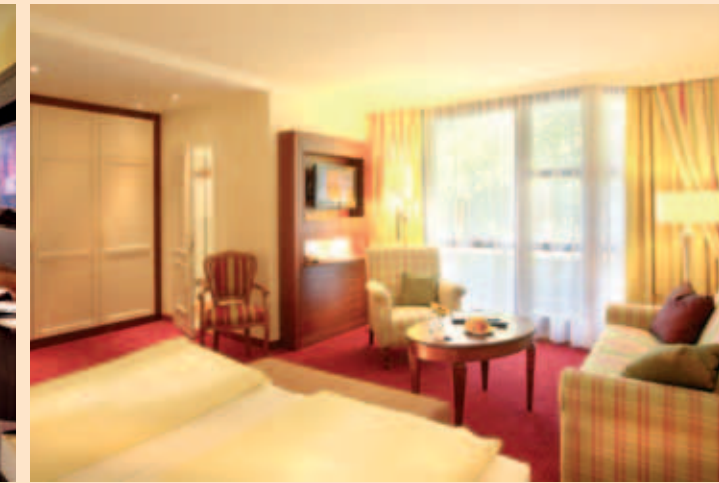
Gemütliche Schönheit: Doppelzimmer Prinzess