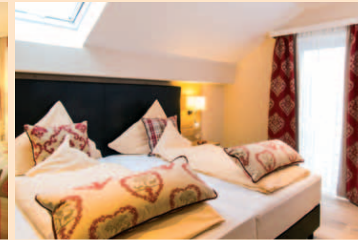
Einmalige Kuschelzone mit 2 Zimmern: Bad Birnbacher Chalet