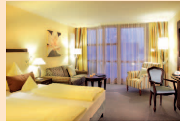
Wohnen in vanilleblau: Doppelzimmer Komtess

ELEGANTER FARBRAUSCH MIT KAMINFEUER & VIEL PLATZ: SUITE CHURFÜRST KOMFORT