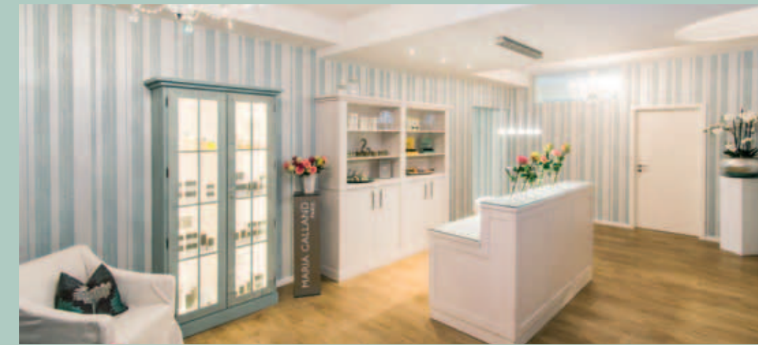
Ganz viel Platz für noch mehr Zeit: 200 qm SPA ROYAL