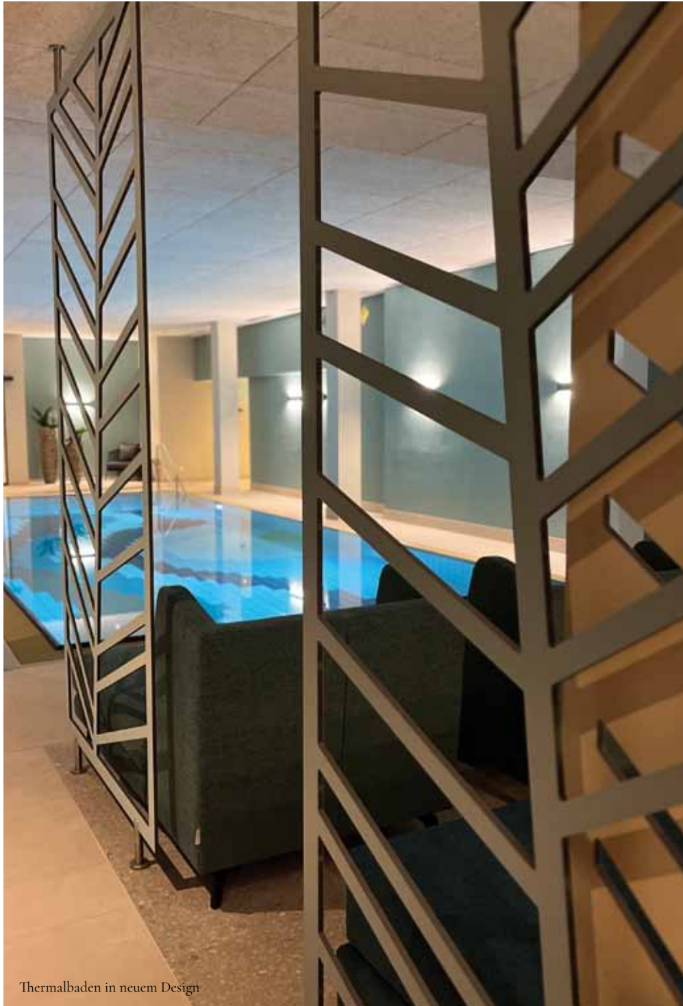
Thermalbaden in neuem Design